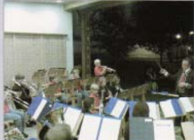
Unser Jugendblasorchester im vollen Einsatz