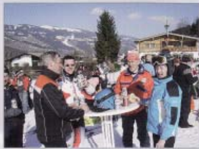
Die verdiente Jause beim Bezirksmusikschreiben in Westendorf