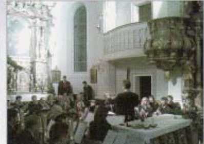
Unsere traditionelle Cäcilien - Festmesse (immer am zweiten Sonntag im November)