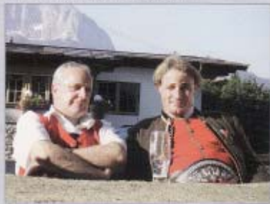
Beim traditionellen Abschlusskonzert September 08