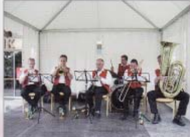
Die Instrumentalbesetzung der MK Reith