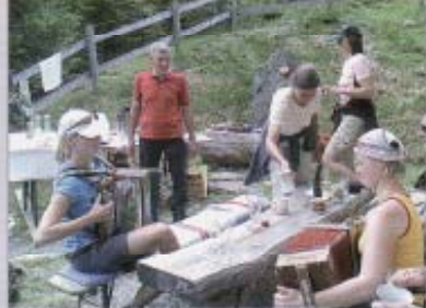
Kameradschaftsspielen auf der Rettensitzalm