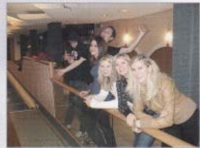
Einladung in der Kegelbahn