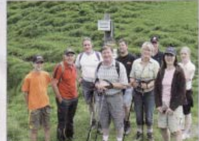
Wanderntag zur Rettensitzalm Juli 08