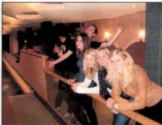
MusikantenInnen beim gemütlichen Kegelabend

Wir sehen uns ... Wir hören uns ... www.mk-reith.at