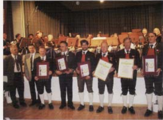
Ehrungen langjähriger Mitglieder