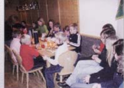
Nachwuchs Pflege (Jause)